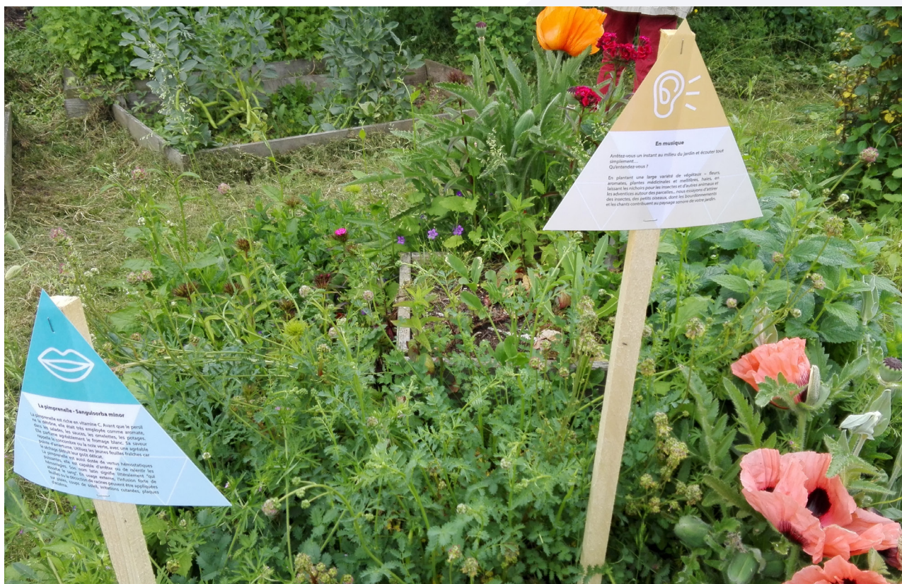
Parcours Eco-errance sur le campus de Marne-la-Vallée